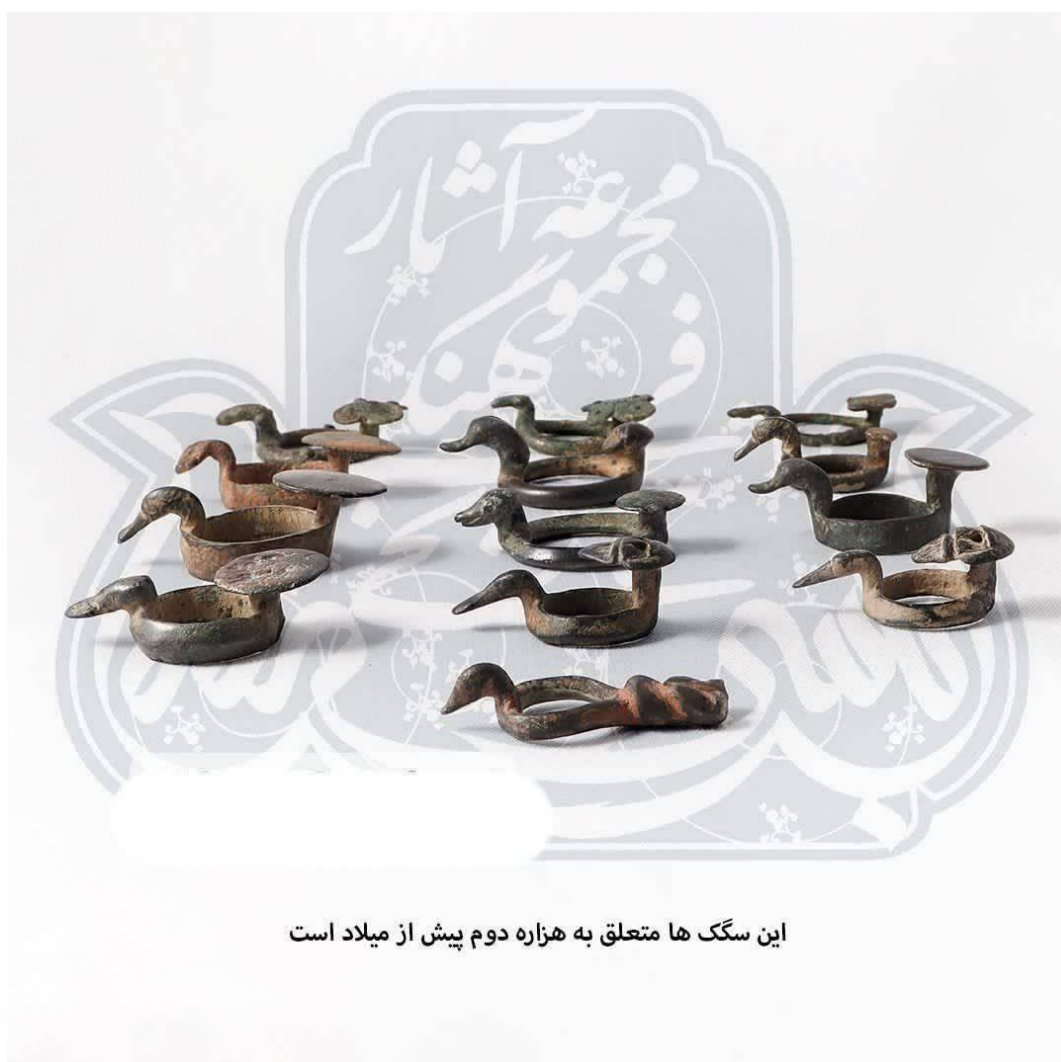
این سگک ها متعلق به هزاره دوم پیش از میلاد است

غار خربس در استان هرمزگان و در قشم واقع شده است. طبق بررسی های انجام شده این غار متعلق به دوره مادها میباشد غارهای خربس را بعضی معبد مهری می پندارند، بعضی آن را استودان (جای نگهداری استخوان های مردگان پس از مرگ، در آیین زرتشت) می دانند و حدسی که قریب به یقین می تواند باشد این است که این حفره ها در دل صخره ها، اگر استودان (استخوان دان) دوره های پیش از اسلام نباشد، به طور مسلم پناهگاهی است برای مردم بی دفاع که روزگاری در دشت هموار خربز زندگی می کرده اند و دزدان دریایی با یورش، امان آن ها را بریده بودند. ناچار، آنان این حفره های در هم را که از درون با یکدیگر مرتبط هستند در دل این دیواره به صورت غارهایی به وجود آورده اند تا به هنگام احساس خطر بتوانند کودکان، زنان و پیرمرد ها را درون آنها اسکان دهند. منبع: کانال دانستنی های تاریخ ایران و جهان باستان