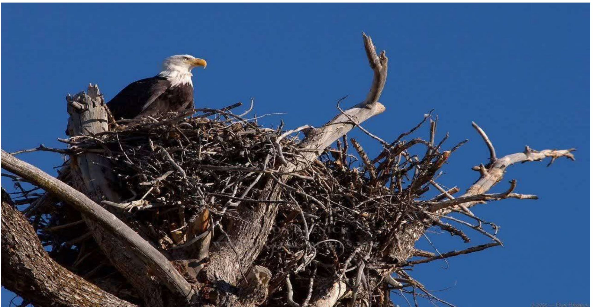
آشیانه عقابها گاه تا ۵۰۰ کیلوگرم وزن و ۳ متر پهنا، بزرگی دارد