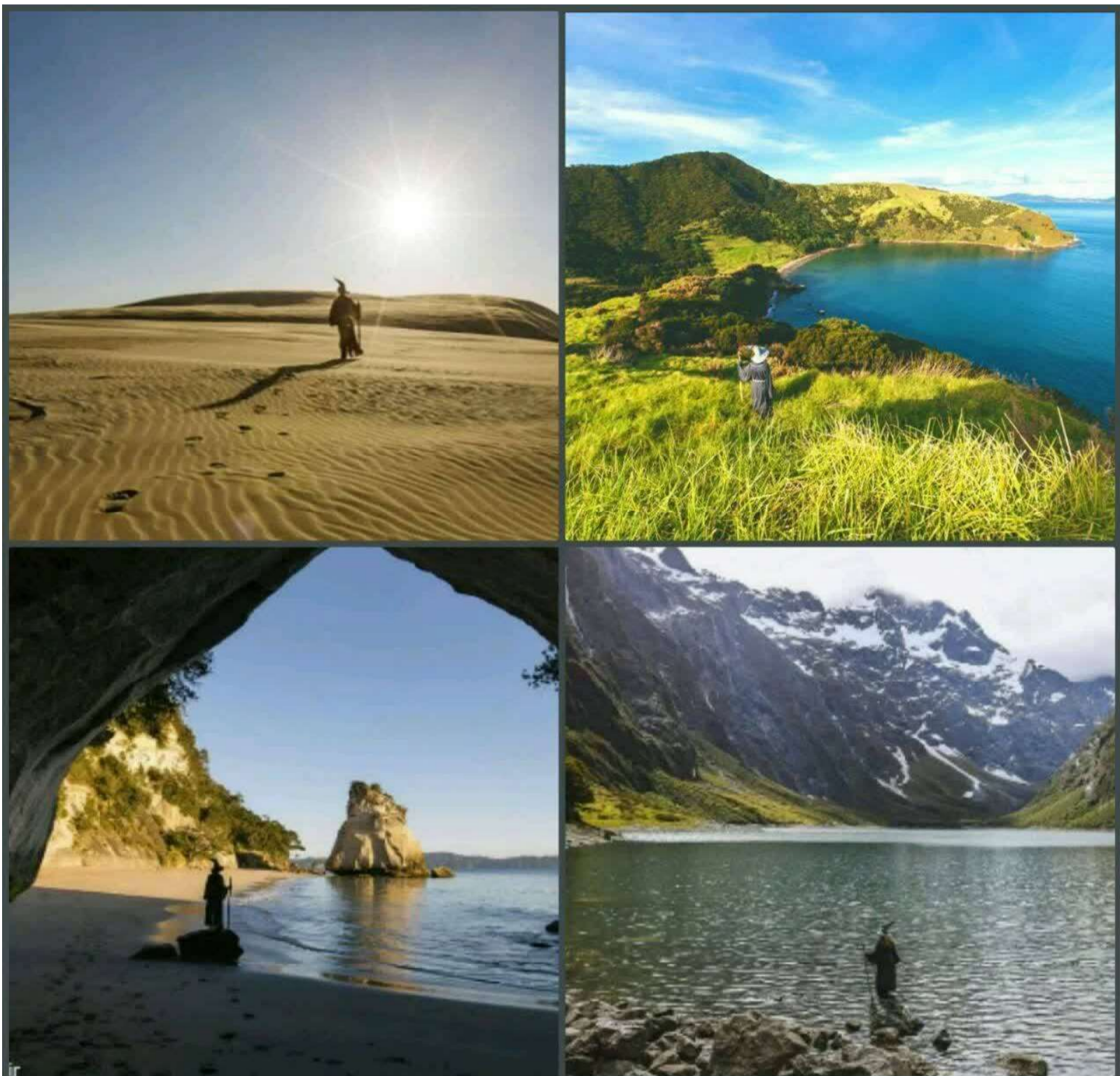
تصاویری از نیوزیلند