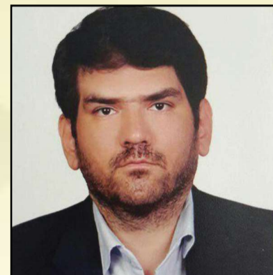
وآینده اقتصاد ایران